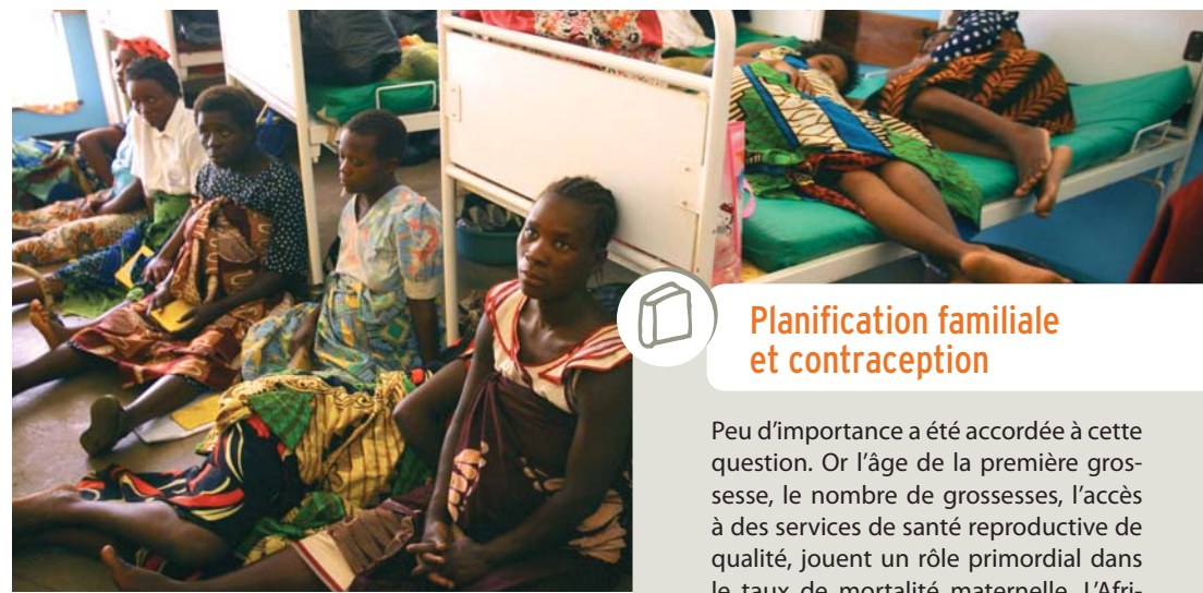
© Abbie Trayler-Smith / Oxfam, Malawi, mai 2007