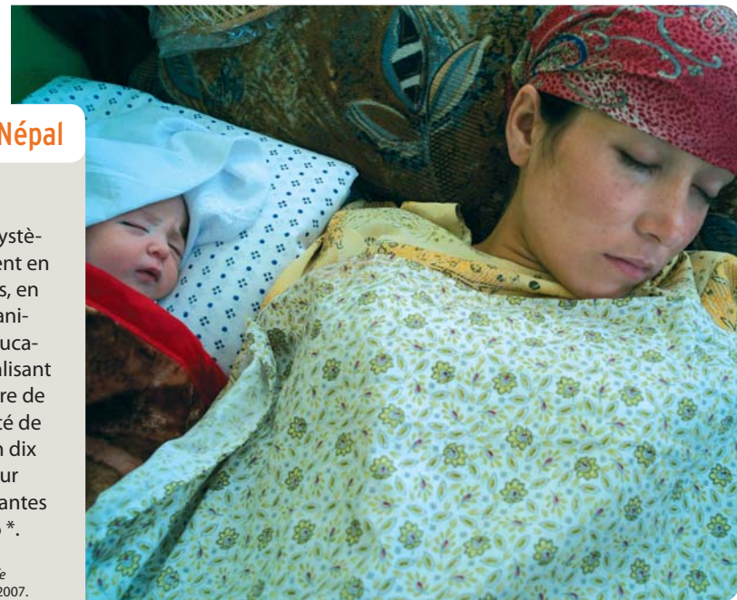
Afghanistan, août 2008