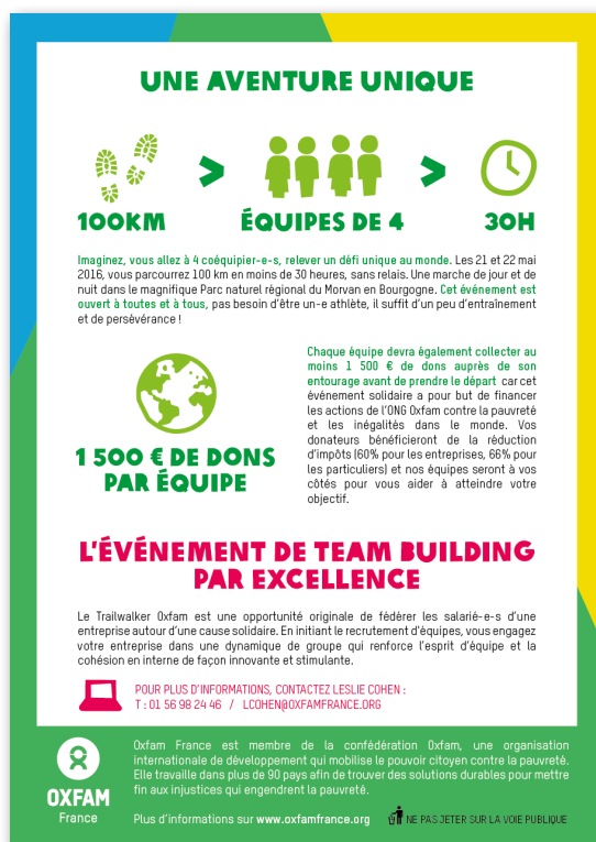
Flyer de promotion du Trailwalker Oxfam 2016