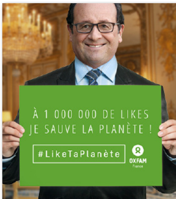
Visuel de la campagne « Like Ta Planète »

Dans le cadre de notre travail sur ces thématiques nous revendiquons la justice et l'égalité entre les femmes et les hommes. Nous appuyons les initiatives de citoyenneté active pour que toutes et tous aient le droit d'être entendu-e-s.