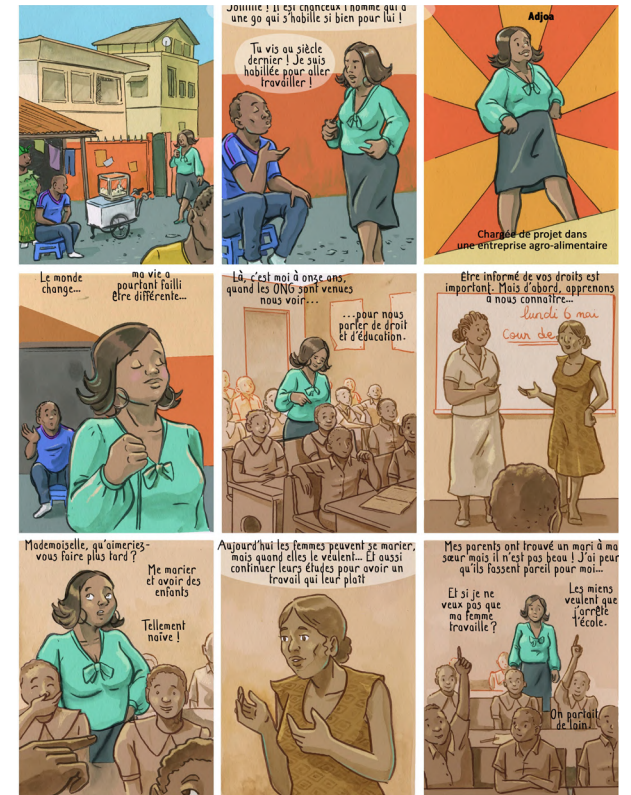
Education des filles au Ghana

Oxfam lance un projet de bande dessinée pour sensibiliser le jeune public à la notion économique d'aide publique au développement. L'APD traduit l'engagement des États développés à consacrer 0,7% de leur revenu national brut aux financements de projets de développement dans les pays pauvres. L'un des principes fondateurs de l'APD est de promouvoir l'égalité des sexes