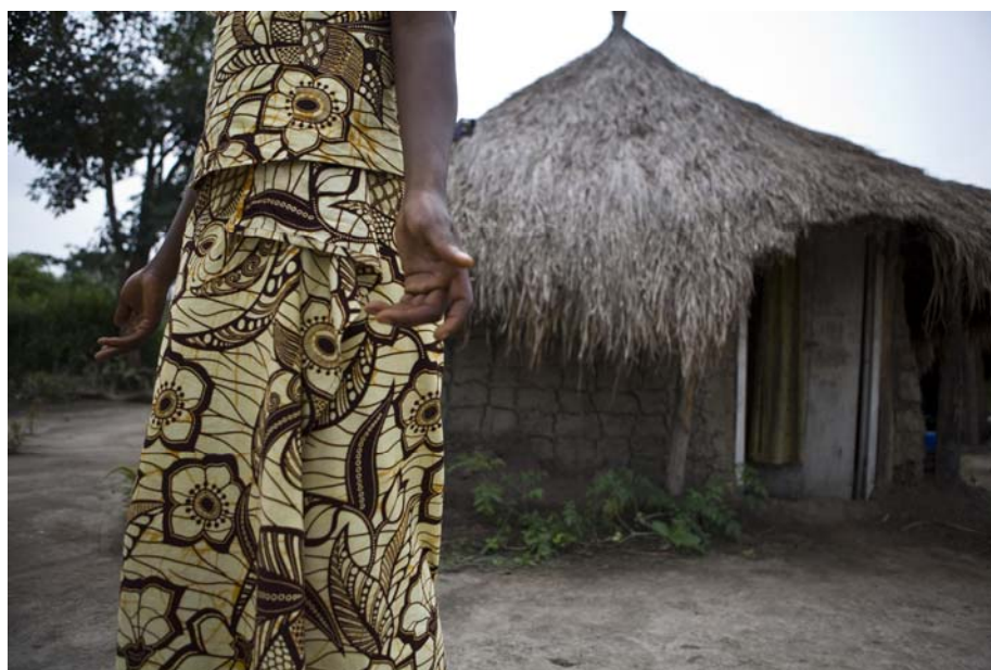
L'une des 1,7 millions de personnes déplacées en RDC devant sa maison dans un camp de déplacés en Province orientale.

Chaque année, Oxfam entreprend une enquête d'envergure auprès de populations touchées par le conflit à l'est de la République démocratique du Congo dont les voix sont trop peu entendues. Trois-quarts des 1 705 personnes interviewées ont le sentiment que leur sécurité ne s'est pas améliorée depuis l'année passée. Dans les zones affectées par l'Armée de résistance du Seigneur (LRA), ce sont 90 pourcent des personnes interrogées par Oxfam qui partagent cette impression; un fort sentiment d'abandon, d'isolement et de vulnérabilité ressort des témoignages recueillis. Partout, les communautés participantes ont brossé un portrait sombre d'abus de pouvoir persistants de la part de milices, militaires et d'autres autorités gouvernementales, mettant sous pression insoutenable leurs moyens d'existence et leurs capacités de survie.