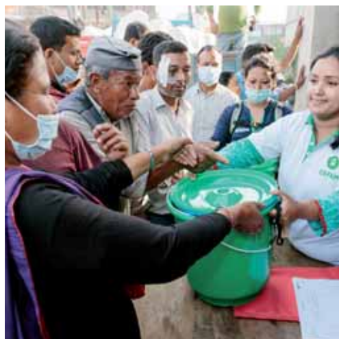
Distribution de kit d'hygiène par Oxfam à Sankhu, au Népal.

Le 25 avril 2015, un puissant séisme a frappé le Népal entre Katmandou, la capitale, et la ville de Pokhara, au nord-ouest, faisant près de 9 000 morts et entraînant la destruction complète ou partielle de plus de 850 000 habitations. Oxfam a immédiatement réagi en fournissant une aide d'urgence comprenant notamment de la nourriture et de l'eau potable, ainsi que des abris provisoires et des latrines. En un an, Oxfam et ses partenaires locaux ont ainsi apporté une assistance vitale à plus de 480 000 personnes dans sept districts, tant dans la phase d'urgence que de reconstruction.