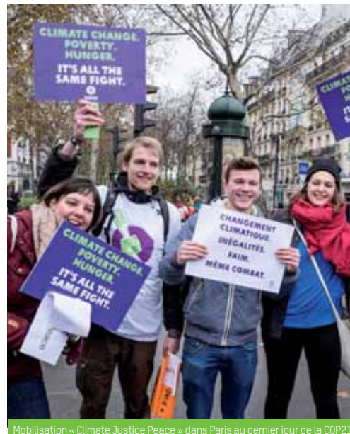
Mobilisation « Climate Justice Peace » dans Paris au dernier jour de la COP21.

L'accord qui a été signé à Paris, même s'il est loin d'être suffisant, constitue une étape importante. Les gouvernements, et plus particulièrement la France qui reste présidente de la COP jusqu'en novembre 2016, devront revoir leurs engagements à la hausse. Nous resterons vigilant-e-s tout au long de l'année et continuerons de porter les voix des populations les plus vulnérables et les plus impactées.