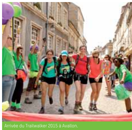
Arrivée du Trailwalker 2015 à Avallon.

Depuis de nombreuses années, c'est le soutien des militant-e-s et des bénévoles d'Oxfam qui rend nos actions possibles et nos messages visibles. Une signature, un don, marcher 60 ou 100 km, quelques heures, un week-end et plus encore, sont autant d'engagements qui font toute la différence. Merci !