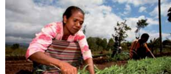
Agricultrice en Indonésie impactée par le changement climatique

Soulignons également le soutien de la confédération au développement de la collecte d'Oxfam France auprès du public, garante de notre indépendance et de notre autonomie. La mutualisation d'une partie des fonds au sein de la confédération rend de tels développements possibles. Toutes ces initiatives, locales et globales, assurent le développement d'Oxfam et ont comme objectifs de renforcer toujours plus « le pouvoir citoyen contre la pauvreté ».