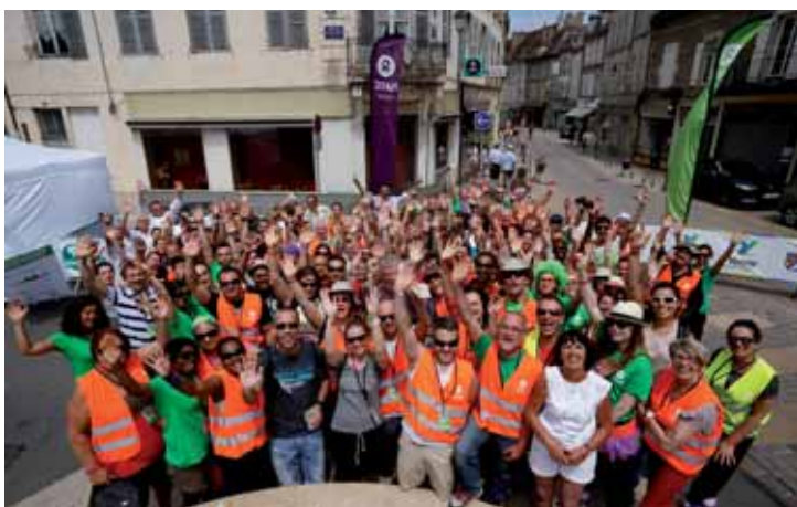
Bénévoles du Trailwalker Oxfam 2015

Oxfam France Service finances 104 rue Oberkampf 75011 Paris